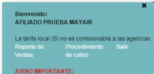
Ilustración 4 - Indicador de Inicio de sesión

Una vez que ingrese con su información de acceso, podrá ver el nombre de su Agencia de Viajes en el lado derecho de la pantalla, lo que indicará que ha iniciado una nueva sesión. A partir de este momento, todas las reservaciones que realice serán identificadas con su nombre (vea la Ilustración 4 ).