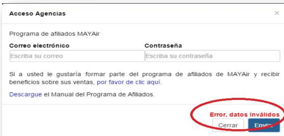
Ilustración 6 - Error

Si se ingresa la información correcta, usted verá el nombre de su Agencia de Viajes en el lado derecho de la pantalla, lo que indica que ha iniciado una nueva sesión (vea la figura 3). Si la información ingresada es incorrecta, un mensaje le señalará que los datos no son válidos (vea la Ilustración 6 ).