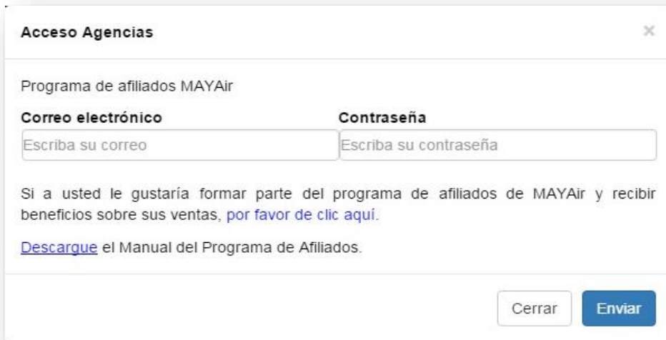
Ilustración 5 - Acceso Agencias

Para hacer una reservación, ingrese su información de acceso (correo electrónico y contraseña) en la sección “Acceso Agencias” en la parte inferior de la página principal (vea la Ilustración 5 ).